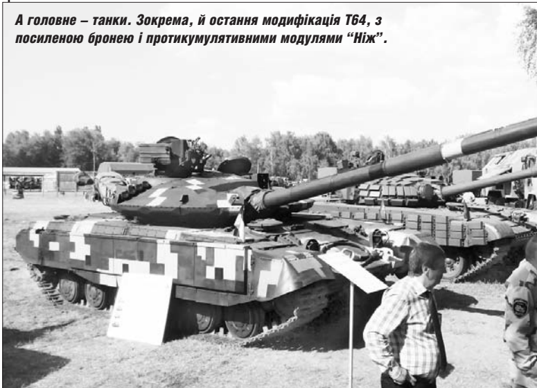
А головне – танки. Зокрема, й остання модифікація Т64, з посиленою бронею і протикумулятивними модулями "Ніж".